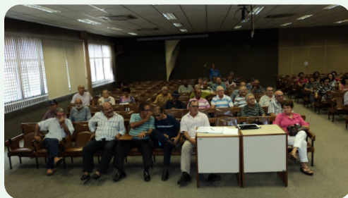
Primeira reunião da Apabanese, em 2011.

COM O PASSAR DO TEMPO E COM O INTUITO DE EXPANDIR OS OBJETIVOS E ABRACAR TODOS OS PARTICIPANTES BANESEANOS EM SEU NOME, A ENTIDADE MUDA SEU NOME PARA ASSOCIAÇÃO DOS PARTICIPANTES ATIVOS, ASSISTIDOS, PENSIONISTAS E APOSENTADOS DO BANCO DO ESTADO DE SERGIPE S.A. E SUAS COLIGADAS (APABANESE).